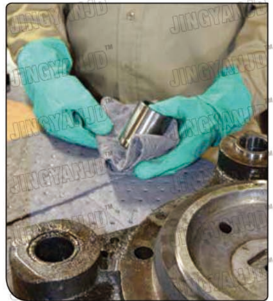
小型吸附垫轻松擦拭和维护零部件。

万用型桶顶吸附垫可以吸收收集或分装过程中的滴液。预先开孔符合 200 升圆桶要求。