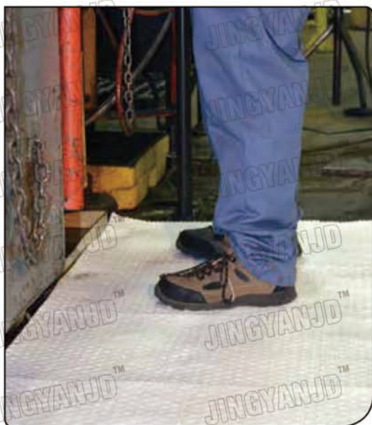
吸附垫可铺在工作场所，保持地面整洁，保障工作环境的安全。